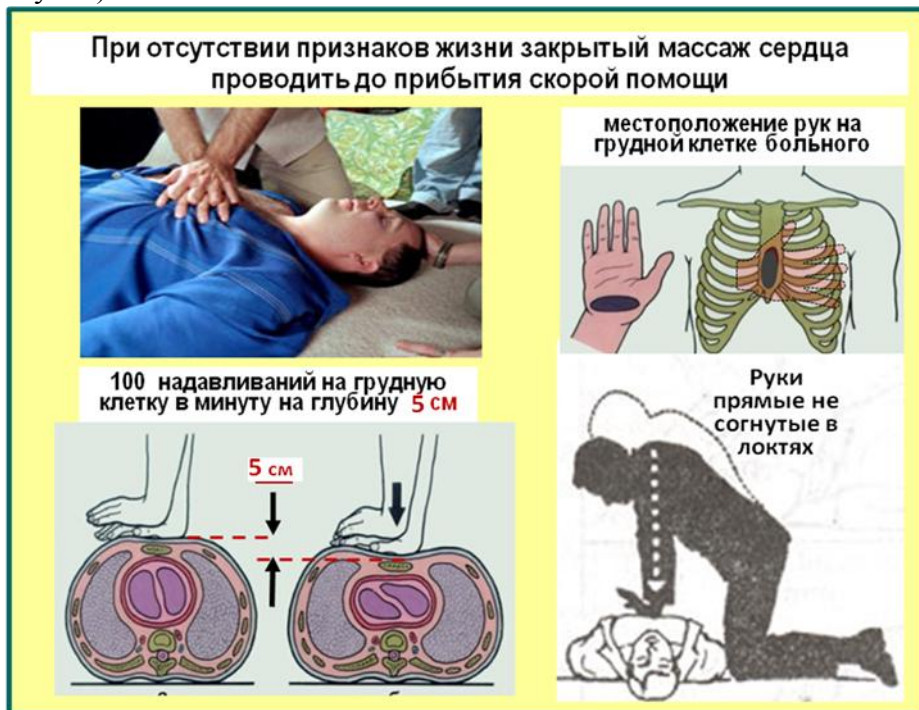
Рис. Иллюстрация методики проведения закрытого массажа сердца.